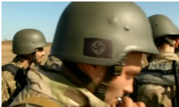
Medlemmer af Azov-bataljonen fremviser hagekorset

Den umiddelbare fare ligger i en uidentificerbar styrke – de neonazistiske militser, der er en uadskillelig del af Kiev-regeringen, som kom til magten for et år siden i et statskup, som disse nazister var drivkraften bag. Disse nazister handler som beskyttede aktiver for Obamaregeringen, mere specifikt for viceudenrigsminister for europæiske og eurasiske anliggender, Victoria Nuland.