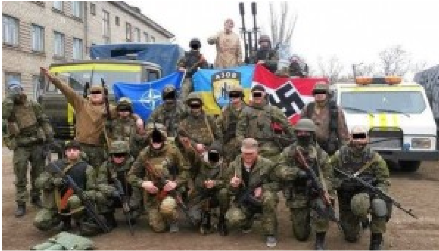
Azov-bataljonen, med både eget flag, Hagekorsflag og NATO-flag!

Disse neonazistiske styrker har officielt afvist våbenhvilen. De bataljoner, som de kontrollerer i det sydøstlige Ukraine, er ikke helt under Kiev-centralregeringens kontrol, men bevæbnes af Ukraines »oligarker« – store forretningsmænd som guvernøren af Dnepropetrovsk, Igor Kolomoisky. De er udløberen af Bandera-bevægelsen, der var fascistisk i sig selv, selv før Anden Verdenskrig, og dernæst bød Hitlers invasion af Ukraine velkommen og udførte grusomheder mod befolkningen i Ukraine og Polen, som burde have anbragt dem på anklagebænken under krigsforbryderdomstolen i Nürnberg. I stedet rekrutteredes de af britiske og amerikanske efterretningstjenester til den kolde krig imod Sovjetunionen.