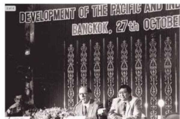
Lyndon LaRouche in dialogue with the audience after speaking at the EIR-sponsored Development of the Pacific and Indian Ocean Basins conference, 1983.