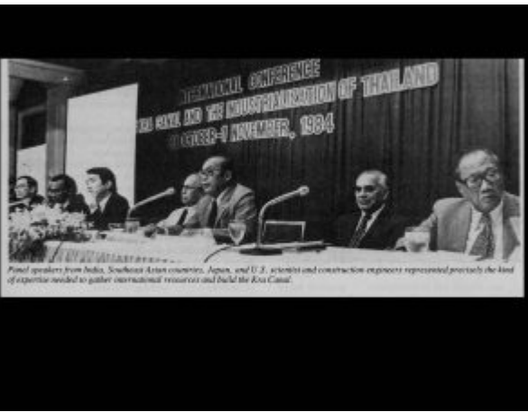
Panel speakers from India, Southeast Asian countries, Japan, and U.S. scientists and construction engineers represented precisely the kind of expertise needed to gather international resources and build the Kra Canal.

He pointed to the importance of the fact that the near success of the project in the 1980s was the result of his