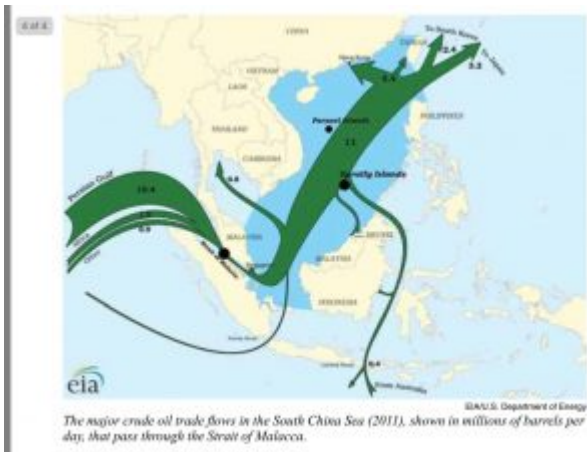
The major crude oil trade flows in the South China Sea (2011), shown in millions of barrels per day, that pass through the Strait of Malacca.

Avisen bemærker ligeledes, at »Lake Chad Basin Commission løste spørgsmålet om finansiering af undersøgelserne af vandoverførsel ved at skabe en Ny Silkevej til Tchadsøen. PowerChina, et af landets største,