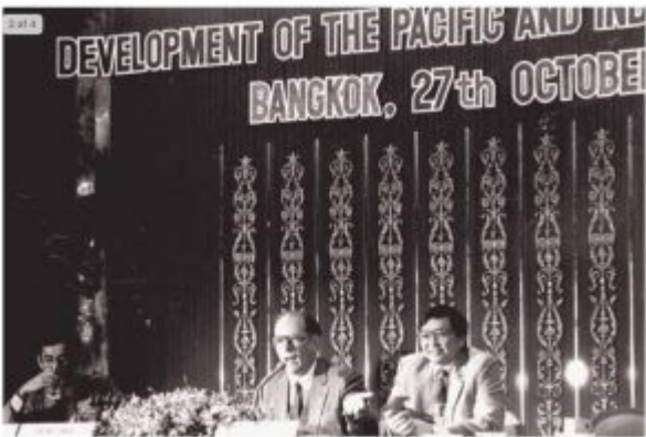
Lyndon LaRouche in dialogue with the audience after speaking at the EIR-sponsored Development of the Pacific and Indian Ocean Basins conference, 1983.