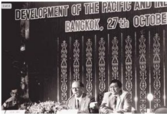
Lyndon LaRouche in dialogue with the audience after speaking at the EIR-sponsored Development of the Pacific and Indian Ocean Basins conference, 1983.