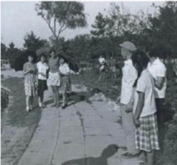
Helga under sit første besøg i Kina, i 1971.

Artiklen fortsætter dernæst med at diskutere Zepp-LaRouches første, lange besøg til Kina som ung journalist under perioden med Kulturrevolutionen. »Min generation var stadig nysgerrig over for verden«, siger Zepp-LaRouche. »I dag googler de unge mennesker blot om ting fra deres søgemaskine. Jeg ville se, hvordan verden ser ud.« I interviewet fortæller Zepp-LaRouche om nogle af sine indtryk fra dengang, inklusive, at nogle af de kinesere, hun mødte, talte tysk og beredvilligt talte om deres situation. »Hun fandt, at folk var 'venlige', men sagde, 'Folk var slet ikke lykkelige'«, skriver Chen. På samme rejse, siger han, besøgte Zepp-LaRouche også Afrika og andre dele af Asien og så den enorme fattigdom. »Jeg kom tilbage fra denne rejse med den absolutte overbevisning, at verden måtte ændre sig, måtte blive forbedret«, sagde hun. Efter hjemkomsten søgte hun efter løsninger og stiftede bekendtskab med den amerikanske, politiske aktivist Lyndon LaRouches arbejde, skriver Chen, »som er bedre kendt som ophavsmanden til LaRouche-bevægelsen«.