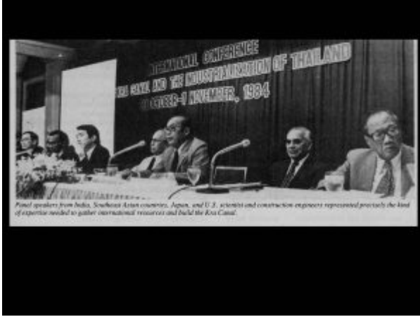
Panel speakers from India, Southeast Asian countries, Japan, and U.S. scientists and construction engineers represented precisely the kind of expertise needed to gather international resources and build the Kra Canal.

As LaRouche said upon learning of the new developments reported here, "the building of the Kra Canal is crucial for all waters and all nations in the region, linking India and South Asia to China and the other East Asian nations. Were it to be done, it would be one of the greatest achievements of modern history." He pointed to the importance of the fact that the near success of the project in the 1980s was the result of his