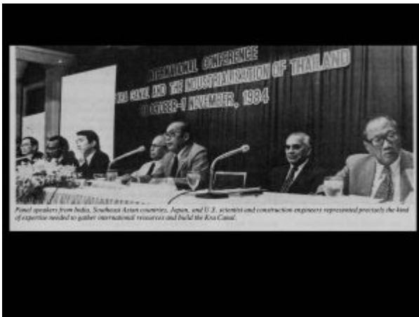
Panel speakers from India, Southeast Asian countries, Japan, and U.S. scientists and construction engineers represented precisely the kind of expertise needed to gather international resources and build the Kra Canal.