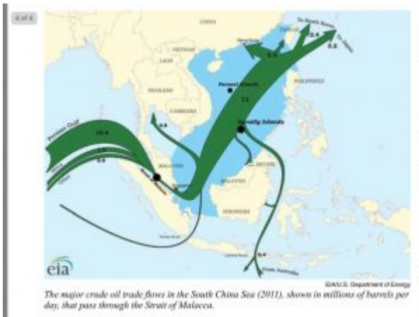
The major crude oil trade flows in the South China Sea (2011), shown in millions of barrels per day, that pass through the Strait of Malacca.

Avisen bemærker ligeledes, at »Lake Chad Basin Commission løste spørgsmålet om finansiering af undersøgelse af vandoverførsel ved at skabe en Ny Silkevej til Tchadsøen. PowerChina, et af landets største,