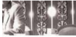
the EIR-sponsored 1983.

As LaRouche said upon learning of the new developments reported here, “the building of the Kra Canal is crucial for all waters and all nations in the region, linking India and South Asia to China and the other East Asian nations. Were it to be done, it would be one of the greatest achievements of modern history.”