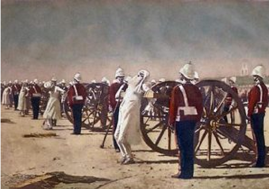
Vasly Vereshchagin: 'The Devil's Wind'