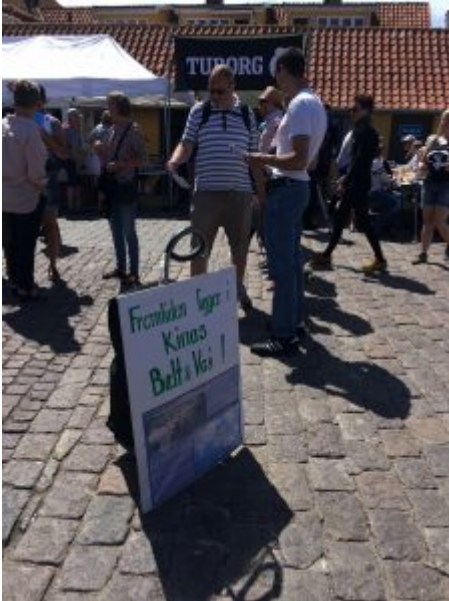
Christian Folkemøde 2017