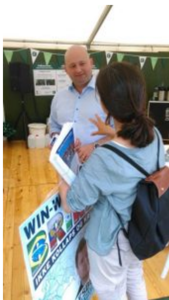
Feride på Folkemødet 2017

Kina. Vi benyttede muligheden for at stille nogle spørgsmål.