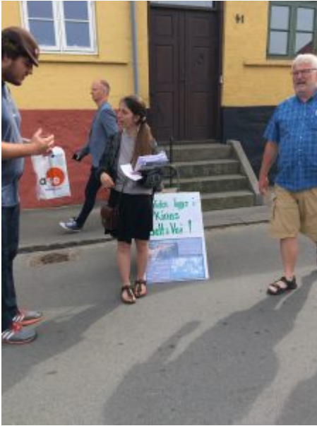
Lissie Folkemødet 2017

samarbejde med Rusland og forhindre en verdenskrig og skabe fred?».