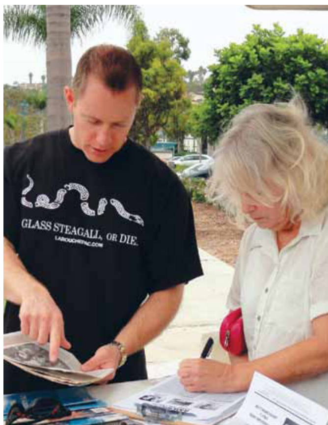
Intet kan redde det transatlantiske finansielle system i dets nuværende form. »Hele systemet er bankerot. Der er ingen udvej – bortset fra en: Glass-Steagall« Billede: LaRouchePAC aktivist i San Diego, Calif., august 2011.

For det første, verden er bankerot. Den transatlantiske region er fuldstændig, håbløst bankerot! Hele Vest- og Centraleuropa er fuldstændig bankerot! Det er under det nuværende system, uopretteligt bankerot. Intet kan gøres