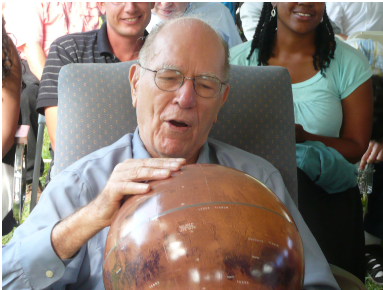
Curiositys landing på Mars var mirakuløs, sagde LaRouche. Et »stort fremskridt« i menneskets udforskning af rummet. Her gransker han en Marsglobus, som han fik i fødselsdagsgave.

Hvorom alting er, så tror jeg på dette: Hvis vi kan etablere et funktionelt præsidentskab i De forenede Stater, sådan som det skete, da De forenede Stater blev etableret under George Washingtons præsidentskab, hvis vi altså har en præsident, og vi bruger vort regeringssystem, vort forfatningsmæssige regeringssystem, så kan vi løse dette problem. Ikke sådan som folk vil have det skal være, som en slags »ønskefabrik«, men med den kendsgerning at vi kan afstikke vejen, og så er det op til folk at følge den vej, og vælge at følge den vej.