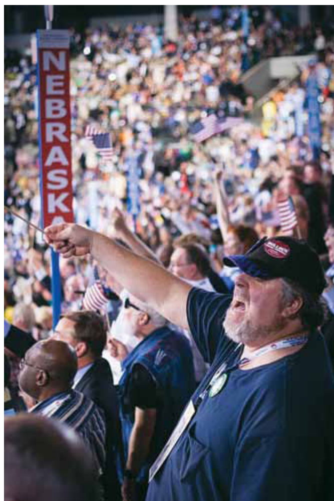
Partisystemet opdanner de fjolede vælgers lidenskaber. De stemmer primært for et parti og sekundært for nationen. Billede: Det demokratiske partikonvent, september 2012.

Det er blevet sagt igen og igen i løbet af USA's historie: