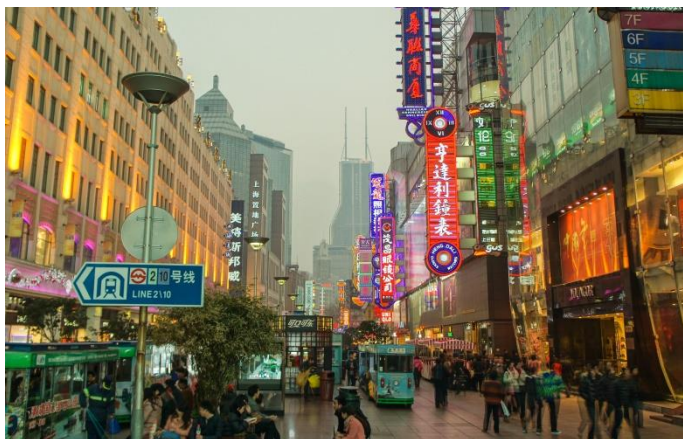
I det moderne Kina »lever folk kun for at tjene penge så hurtigt som muligt«. Vist her, en gågade i Shanghais forretningskvarter.

at disse teorier, disse tanker, stadig er meget anvendelige, meget lærerige for det kinesiske folk, men også for folk i andre lande. For Konfucianisme vil sige, at vi bør gøre det klart for alle mennesker, for alle dele af samfundet, for enhver organisation i samfundet, hvad der er vores mission, vores holdning og vores fælles indsats for det samme mål.