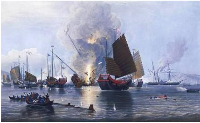
Englands HMS Nemesis ødelægger i 1841 kinesiske skibe under Opiumskrigen: maleri af Edward Duncan (1843). Europæernes besejring af Kina førte, iflg. dr. Cui, til, at mange kinesiske intellektuelle følte sig desillusioneret over Konfucianismen, fordi den ikke hjalp dem til at forhindre de europæiske erobringer.

europæiske landes kolonisystem. På den tid følte de traditionelle, kinesiske intellektuelle sig mere og mere skuffede over Konfucianisme, for de tænkte, at uanset, hvor god den var, så hjalp den ikke det kinesiske folk til at undgå denne skæbne, hvor de blev besejret på denne måde.