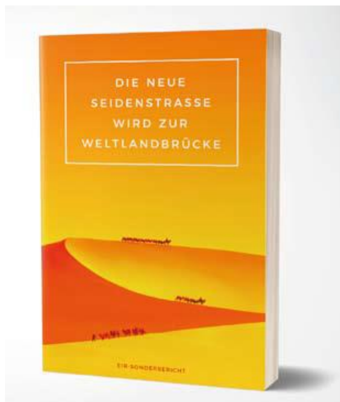
Den tyske udgave af EIR's Specialrapport: »Den Nye Silkevej bliver til Verdenslandbroen.«

Hele BüSo's valgprogram kan ses på BüSo's valgportal: http://bundestagswahl2017.xn--brgerrechtsbewegung-solidaritt-otc35e.de/