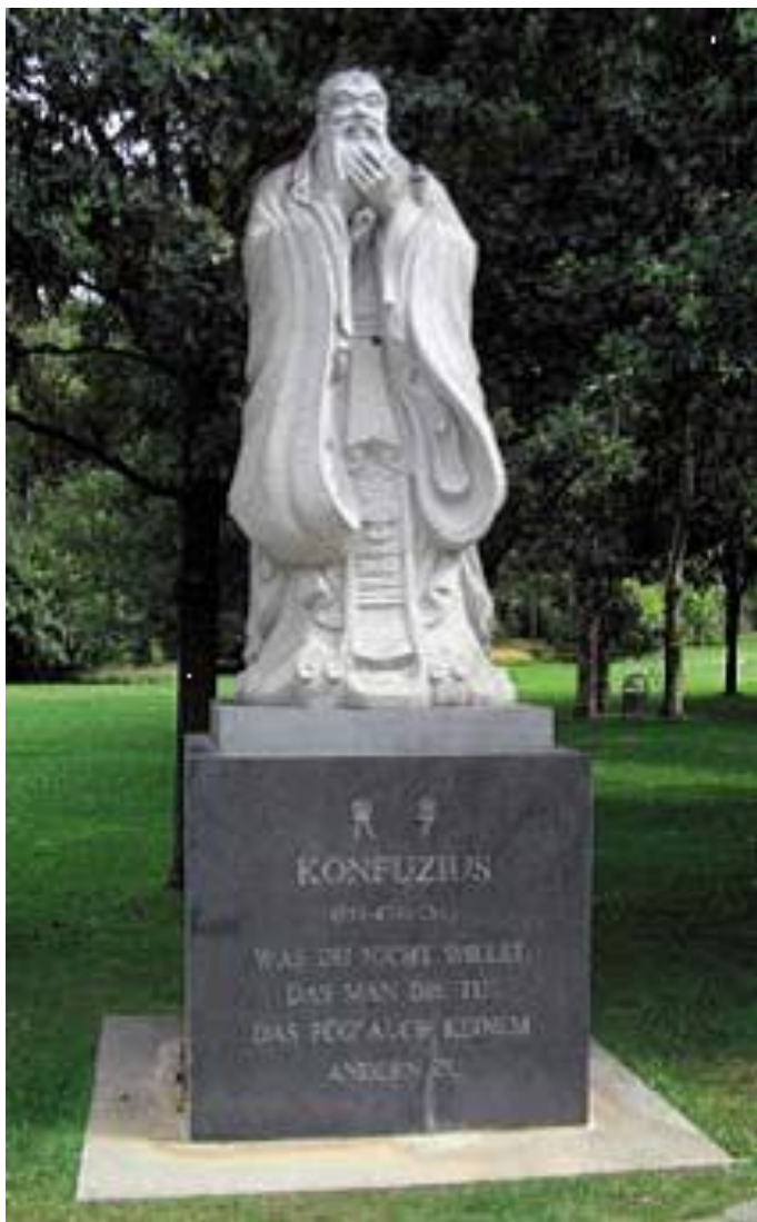
Konfucianismen præger den kinesiske politik. (Konfucius-mindesmærke i Berlin)

de vi overveje samarbejde om opbygningen af den Nye Silkevej, der bliver til Verdenslandbroen, som grundlag for en ny, international sikkerhedsarkitektur, der tilgodeser hver enkelt stats sikkerhedsinteresser. Kun sådan er en virkelig fredsorden mulig.