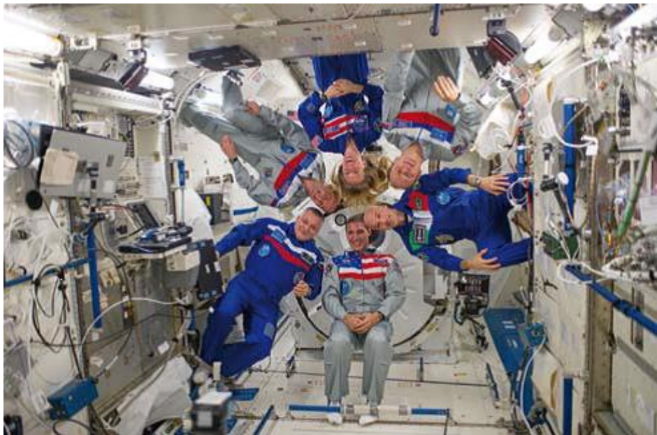
Perfekt samarbejde: Verdensrummet kender ikke til grænser.

Vi ser i dag, hvordan astronauterne på den Internationale Rumstation (ISS) arbejder sammen på tværs af alle nationale skranker og altid fortæller, at synet af Jordan fra rumstationen lader ideen om den ene menneskehed træde tydeligt frem. Vi må altså organisere samarbejdet mellem nationerne på samme måde som videnskabsfolk, der udveksler deres opdagelser af universelle principper med det formål at fremme erkendelsen, eller som astronauterne, der sammen trænger ind i Universets hemmeligheder, eller som de internationale medlemmer