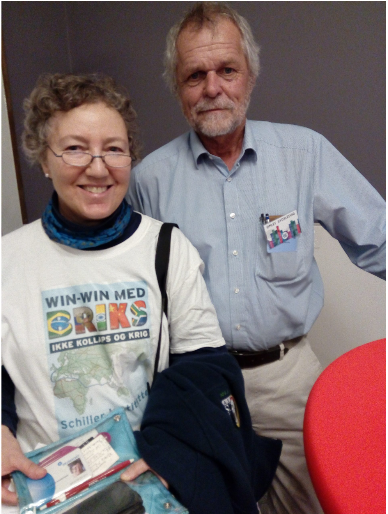
Sydslesvigsk Vælgerforening, Det danske mindretal