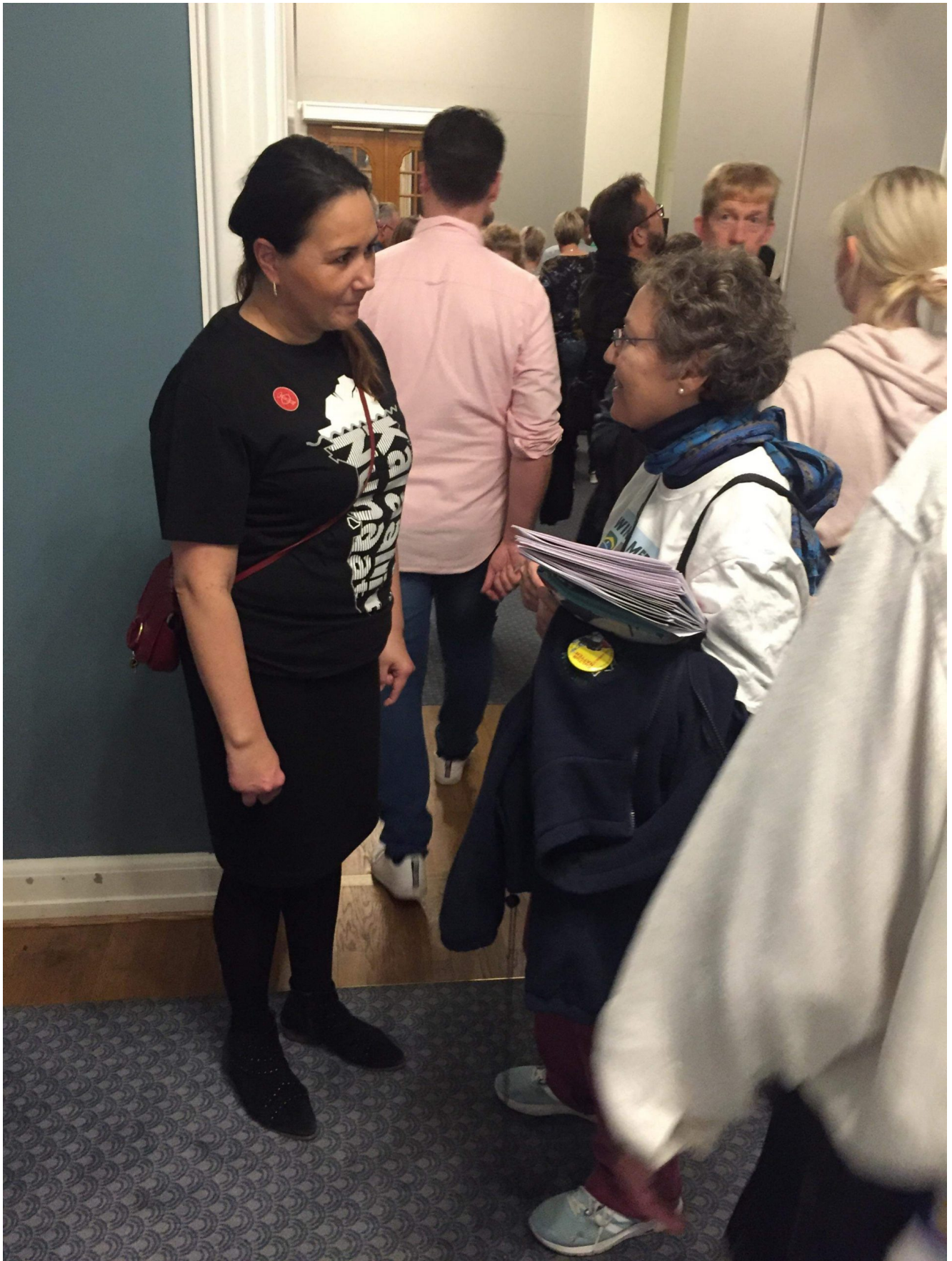
Grønland, Inuit Ataqtigiit