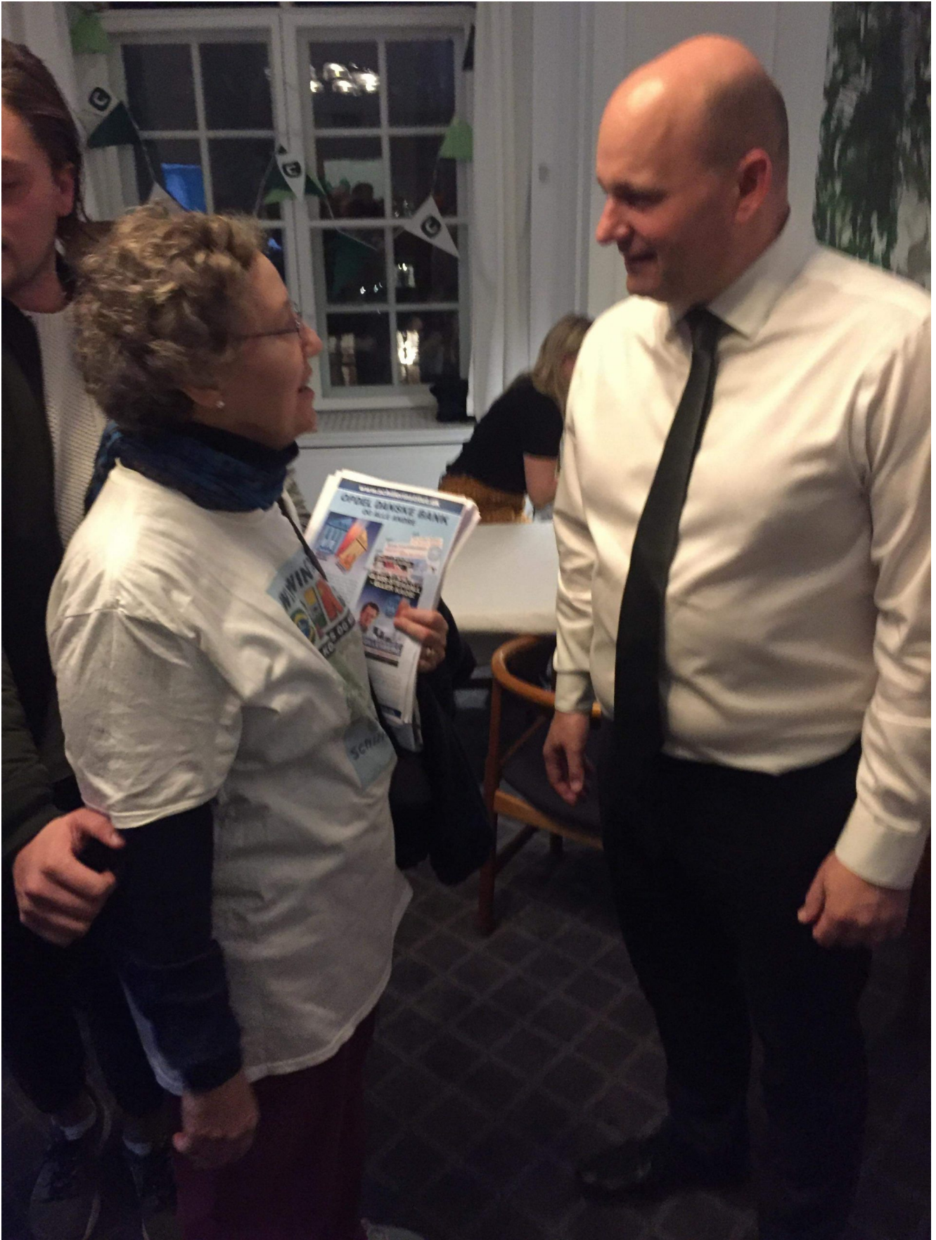
Det Konservative Folkeparti