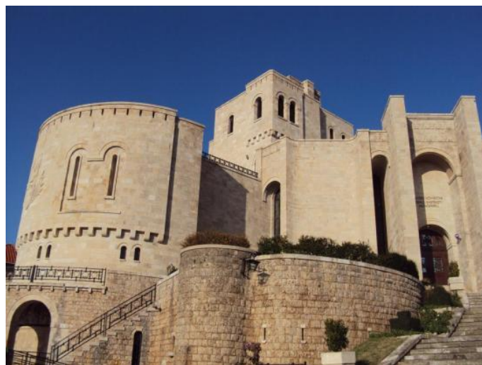
Skanderbegs borg i Krujë

Vatikanet knyttede under Pave Pius 2. relationer til Skanderbeg for at hjælpe ham, da han ikke alene kæmpede for sit folks frihed, men også for hele den kristne verden. Pave Pius gav ham ærestitlen »Atletha Christi« (en kæmper for Kristus). Mens Skanderbeg holdt det Osmanniske Rige i skak på den ene side af det Ioniske Hav, havde den anden side af det Ioniske Hav sin ryg fri, hvilket muliggjorde den italienske renaissance. Desværre har kun få kendskab til albanernes historie.