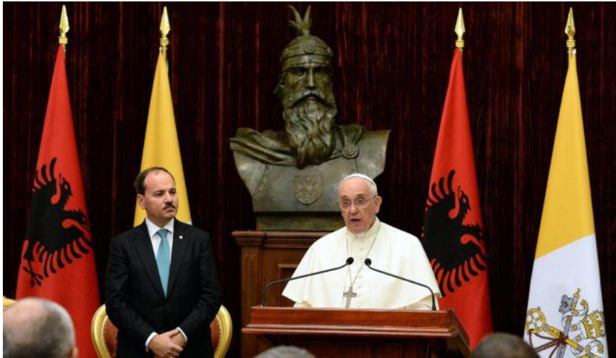
Pave Frans taler i det albanske parlament. Ved hans side står præsidenten, Bujar Nishani. I baggrunden ses en buste af Albaniens nationalhelt, Skanderbeg.