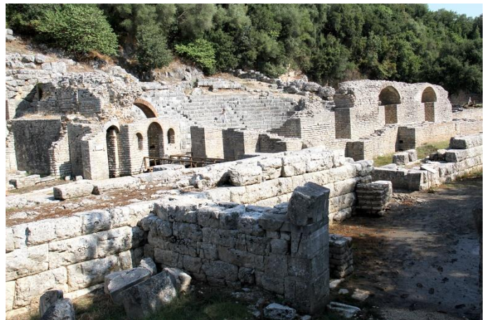
Butrint i det sydlige Albanien, oprindeligt en illyrisk by, der blev erobret af romerne. Byen blev forladt i middelalderen. I Albanien vælter fortidsminderne op af jorden.

mand eller kvinde – også dem, der ikke tilhører vores egen religiøse tradition – ikke ser en rival, og endnu mindre en fjende, men ser brødre og søstre. Grundlæggende set er vi allesammen pilgrimme på denne jord, og på vores rejse her lever vi i vores længsel efter sandhed og evighed, ikke som væsener, der er adskilt fra andre, ... men som væsener, der er afhængige af hinanden ... Den anden holdning er engagementet til fordel for det almene vel. Hver gang, ens tilhørsforhold til ens egne, religiøse traditioner frembringer en mere overbevisende, mere nådig og mere uselvsk tjeneste for hele samfundet, er det en autentisk udøvelse og udvikling af religionsfriheden ... Jo mere, man er til tjeneste for andre, desto mere fri er man. Ser vi os omkring og ser, hvor meget nød, der er blandt de fattige, spørger vi, hvor længe skal vores samfund søge efter vejen til en mere udvidet social retfærdighed, til en inkluderende økonomisk udvikling? Mænd og kvinder, som er inspireret af deres egen religiøse tradition, kan yde et uudværligt bidrag til at virkeliggøre denne søgen.«