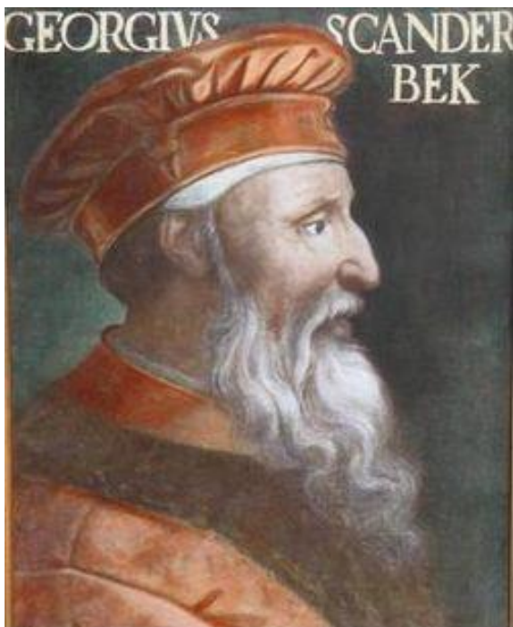
Portræt af Skanderbeg, »Dominus Albaniae« (Albanernes herre). Uffizi-gallerierne, Firenze.

Pave Frans henviste til, at evangeliet allerede i apostlen Paulus' tid blev forkyndt i Illyrien, som albanernes forfædres land hed. De fleste mennesker ved ikke, at albanerne har været kristne indtil midten af det 15. århundrede. Så kom den brutale invasion af det Osmanniske Rige. Efter at vores nationalhelt Skanderbeg døde, gik det Osmanniske Rige grusomt til værks med at statuere et eksempel, for at befolkningen ikke mere skulle omvende sig til Kristendommen. Det Osmanniske Rige herskede i 500 år på hele Balkan.