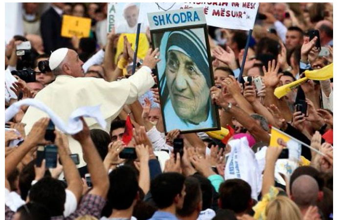
Moder Teresas popularitet i Albanien er meget stor.

Poul 2. helgenkårede Moder Teresa. Moder Teresas hengivenhed over for menneskeheden har givet albanerne et ry i verden, og alle albanere elsker hende og er stolte af hende.