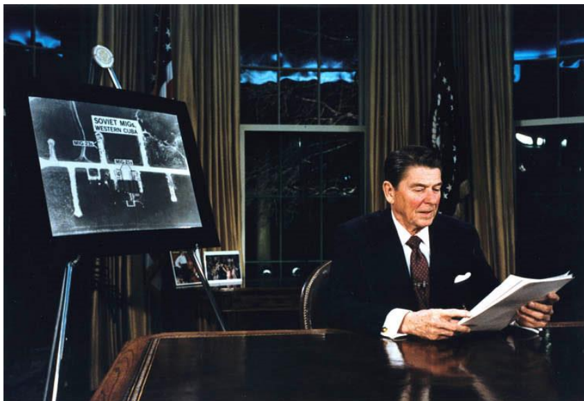
Præsident Reagan annoncerer SDI på landsdækkende Tv, 23. marts 1983.

Under en præsidentkandidat-debat i New Hampshire, sponsoreret af National Rifle Association i begyndelsen af 1980, fik LaRouche lejlighed til at tale direkte med Reagan, og de to mænd indledte et personligt samarbejde, der skulle få historiske konsekvenser, og som kulminerede i præsident Reagans landsdækkende tale i Tv den 23. marts 1983, hvor han annoncerede lanceringen af det Strategiske Forsvarsinitiativ (SDI).