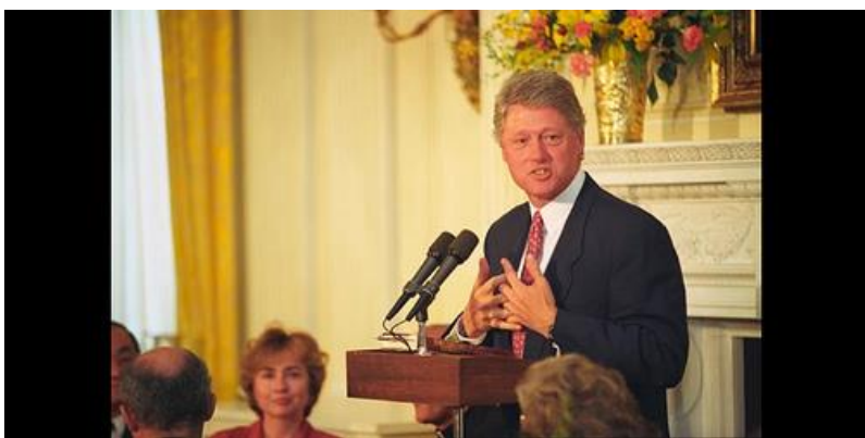
Præsident William J. Clinton, mål for britisk, politisk mord, under en Interfaith-frokost i det Hvide Hus.