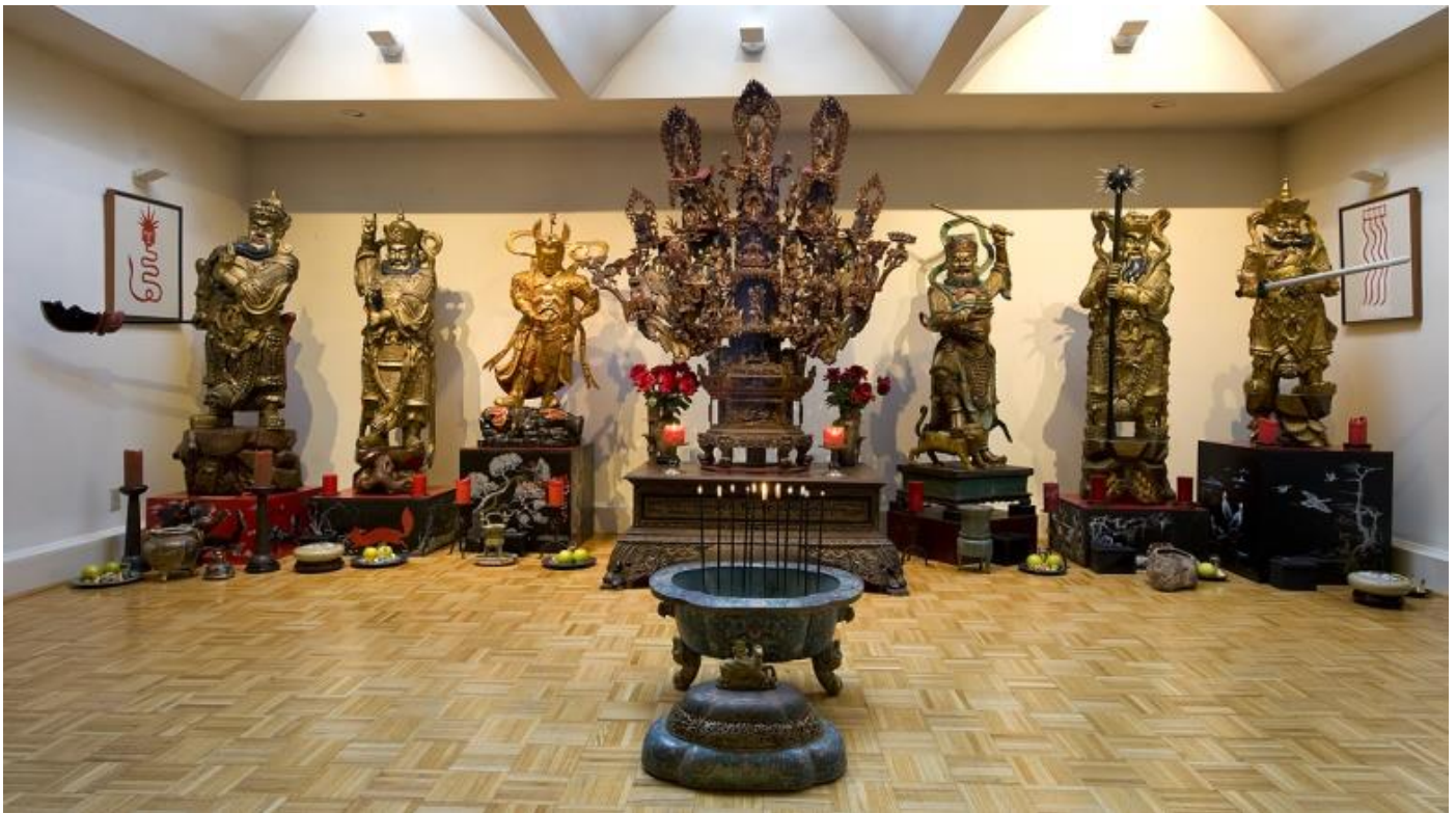
Nogle af de 400 taoistiske guder i et tempelområde, beregnet til bøn og meditation.