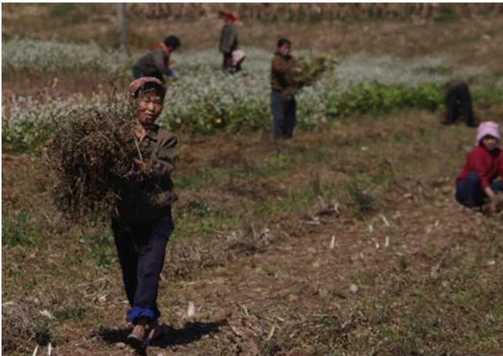
Det taoistiske ideal om arbejde udføres her på en mark i Nordkorea.

Konfucianeren siger: »Hvis du havde en maskine her, kunne du på en dag vande hundrede gange dit nuværende område. Den nødvendige arbejdskraft er ubetydelig i sammenligning med det udførte arbejde. Kunne du ikke tænke dig én?« Han beskriver en skvatmølle, hvis foddrevne træk med træskovle hæver vandet op fra en overvandingegrøft.