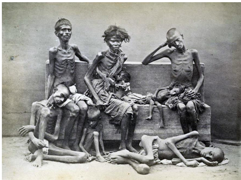
Ofre for den »moderne« indiske hungersnød, forårsaget af Winston Churchill, den Bengalske Hungersnød fra 1943.

I hele den kvælende sommer i 1770 fortsatte folk med at dø. Husmændene solgte deres kvæg; de solgte deres landbrugsredskaber; de åd deres såsød; de solgte deres sønner og døtre, indtil der ikke længere kunne findes børneopkøbere; de åd træernes blade og markernes græs ... gaderne var fulde af et virvar af bunker, med døende og døde. Begravelsesfolkene kunne ikke udføre deres arbejde hurtigt nok; selv hundene og sjakalerne, Østens offentlige ådselædere, var ikke i stand til at udføre deres frastødende arbejde, og mængden af lemlæstede og rådnende lig i massevis truede borgernes liv ... 3