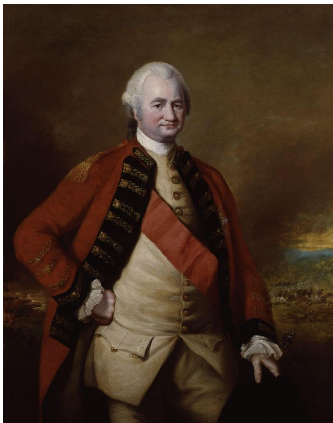
»Slagteren fra Bombay«, det Britiske Ostindiske Kompagnis Baron Robert Clive. Maleri af Nathaniel Dance.

førte til disse udbrud af hungersnød, men det er løgn. Britiske herskere, der udkæmpede krige i Europa og andetsteds, og som koloniserede dele af Afrika, eksporterede korn fra Indien for at kunne opretholde deres kolonierobringer – mens hungersnøden rasede. Folk i de områder, der var ramt af hungersnød, lignede skeletter kun overtrukket med hud, vandrede rundt, krøb sammen i hjørner og døde i millionvis.