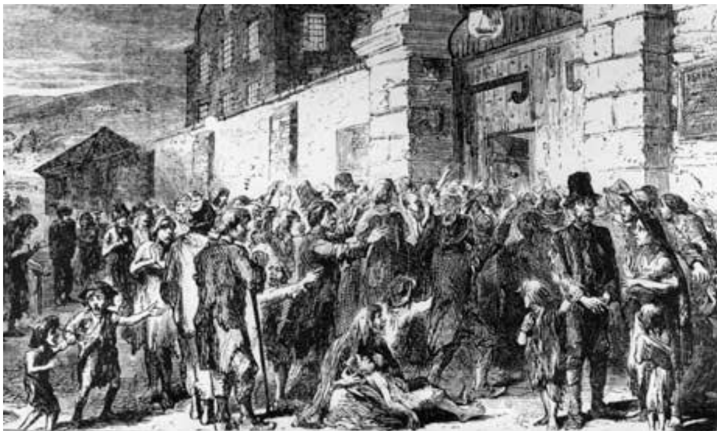
Sultende irske bønder ved portene til et arbejdshus.

skotske, protestantiske jordbesiddere havde muliggjort økonomisk udvikling; det førte faktisk til en forenet katolsk-protestantisk bevægelse for uafhængighed. Den Forenede Irske bevægelse og Irske Frivillige militær vandt Forfatningen af 1782, under den Amerikanske Uafhængighedskrig.