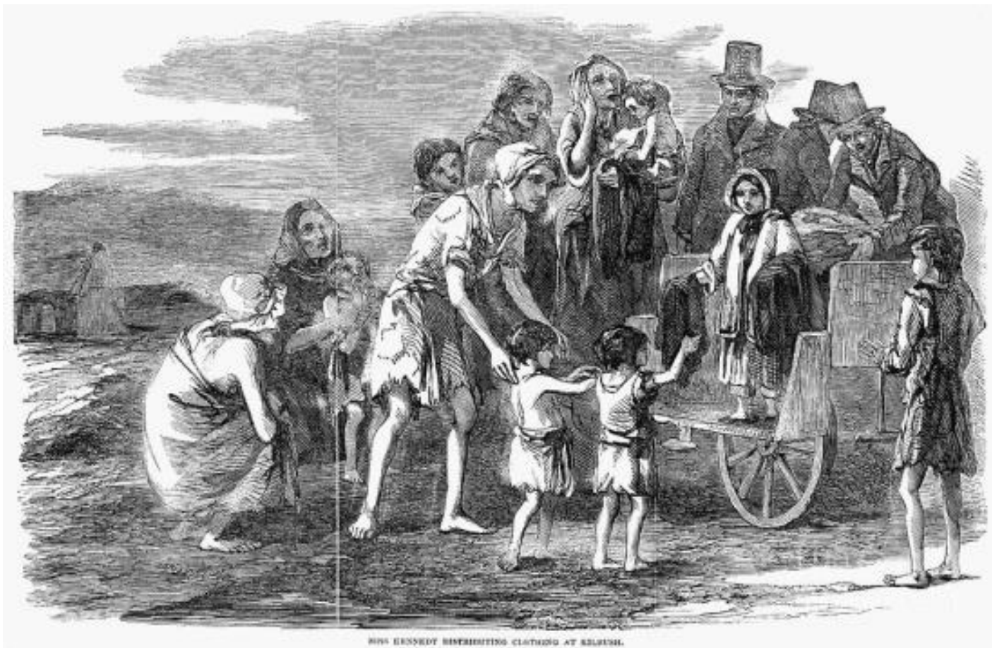
Der uddeles tøj under den irske kartoffelhunger.

Gennem deres citerede udtalelser om denne folke-mordsepisode, som vi efterfølgende vil præsentere, vil man præcist genkende Prins Philip »Dødbringende Virus« Windsors anskuelse i dag med hensyn til at reducere befolkningen – forureningen, efter hans mening – af »jævne« folk i verden.