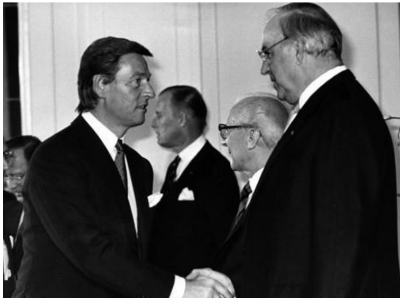
Deutsche Banks bestyrelsesformand Alfred Herrhausen (venstre) hilser på den tyske kansler Helmut Kohl.

den foreløbige fremkomst af systemet med moderne nationalstater, og moderne politisk økonomi, lancerede Imperiet en række religiøse krige, der kastede Europa ud i en tilstand af absolut kaos i mere en halvandet århundrede, igennem hele perioden med Trediveårskrigen.