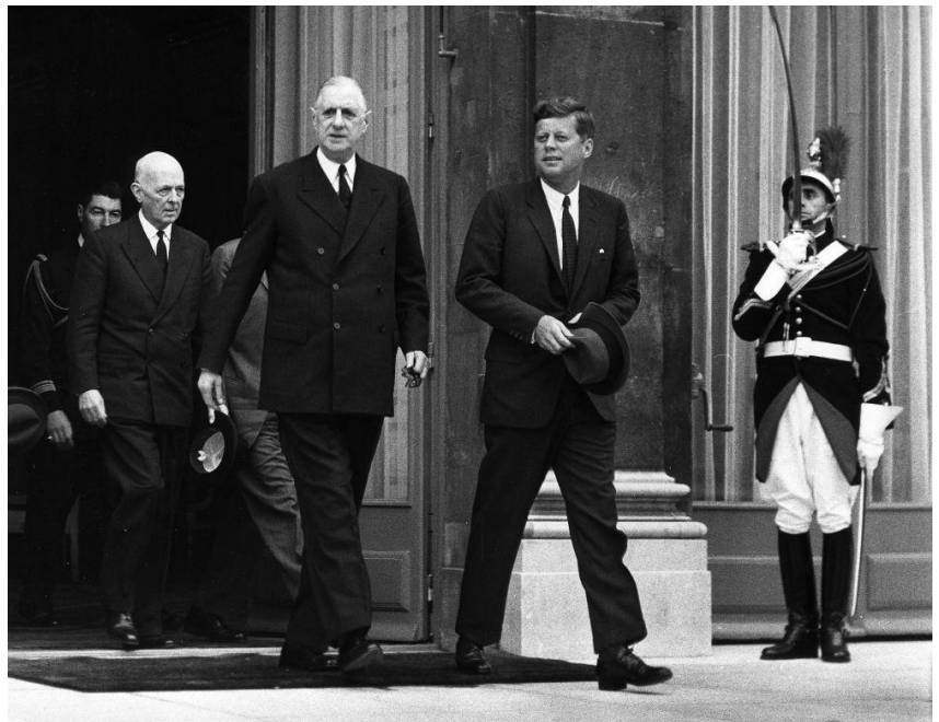
I den britiske krones krydsild: Den franske præsident Charles de Gaulle og den amerikanske præsident Kennedy ved Elyséepalæet i Frankrig, 31. maj, 1961.

Og dette var de netværk, der var involveret i Kennedy-mordet. De var direkte involveret i mordforsøgene og den sluttelige afsættelse af Charles de Gaulle. Og, naturligvis, med tilføjelsen i 1960'erne af mordene på Martin Luther King, Robert Kennedy og Enrico Mattei i Italien. Der var