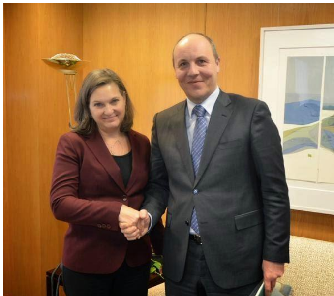
Den amerikanske viceudenrigsminister for europæiske og eurasiske anliggender, Victoria Nuland, med den ukrainske kupleder Andriy Parubiy, i Washington, D.C., 26. februar 2015.

Der er nu Glass-Steagall-lovforslag i både Senatet og Repræsentanternes Hus ('Huset'); faktisk blev der i denne uge introduceret endnu et Glass-Steagall-lovforslag, med samme ordlyd som Warren/Cantwell/McCain/King-forslaget i Senatet, i Huset af nogle af de samme mennesker, der sponsorerede det tidligere lovforslag fra Marcy Kaptur, inklusive kongresmedlem Walter Jones. Så løsningen er der; den er på bordet. Det er aldrig et