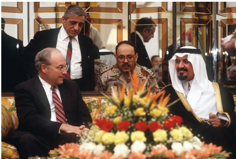
To af hovedrepræsentanterne for »u-ordenen«: Tidl. vicepræsident Dick Cheney og daværende kronprins Sultan af Saudi Arabien, under et møde i 1990.

Det, som de vestlige, bestialske ideologer og politikere som Dick Cheney og Tony Blair har til fælles med deres modparter i Saudi Arabien, ISIL og al-Qaeda, er processen med at dehumanisere individer og grupper. Det er ingen tilfældighed, at mange af ISIL's irakiske, militære topledere er tidligere irakiske soldater og officerer i den Republikanske Garde og i specialstyrker, som, efter invasionen af Irak i 2003, blev fængslet og tortureret af amerikanske og britiske styrker på den mest utænkkelige og ydmygende måde på sådanne berygtede steder som