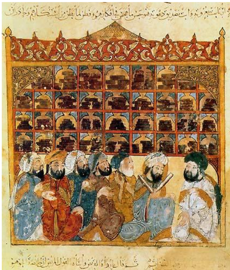
Maqamat al-Hariri Library, illustration by Yahya al-Wasiti, Baghdad 1237 Lærde i et Abbaside-bibliotek.

Denne kendsgerning gjorde det muligt for dynastiet at opbygge en massiv hær, for hvilken det lykkedes at ekspandere imperiets indflydelse mod vest ind i Centralasiens tyrkiske steppe, og som dominerede og fik gavn af handelen på Silkevejen. Mange små kongedømmer og byer betalte skat til Tangkejseren og skabte rigdom fra den frugtbare Ferghana-dal, der fik vand fra Syr Daryafloeden, som i dag er fælles for Kirgisistan, Usbekistan og Tadsjikistan.