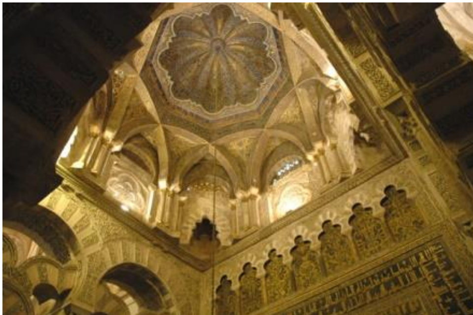
Interiør fra Den store Moske i Cordoba, bygget af 'Abd al-Rahman I i 786-787 e.Kr.

Handel, der havde udviklet sig massivt takket være landbrugs- og industriudvikling i islams tidlige århundreder, trivedes. Den islamiske verden fra Indus og Centralasien og til Pyrenæerne i Europa, var et »fællesmarked«. Købmænd, der rejste over lange afstande med deres varer, foretrak ikke at medbringe guld- eller sølvmonter på rejsen. Papir-kredit, såsom remburs ( Suftaja ) og checks (oprindeligt fra det persiske Sakka eller arabiske Sakk ), blev brugt i udstrakt grad i Silkevejens handelscentre, og i Afrika og Middelhavsområdet. Kopier af disse blev fundet blandt Geniza-papirerne, der refererer til opdagelsen i slutningen af det nittende århundrede i Genizah (hebraisk for lagerrum) Ben Ezra-synagogen i Gamle Cairo, Egypten, af en samling bestående af næsten 300.000 manuskripter.