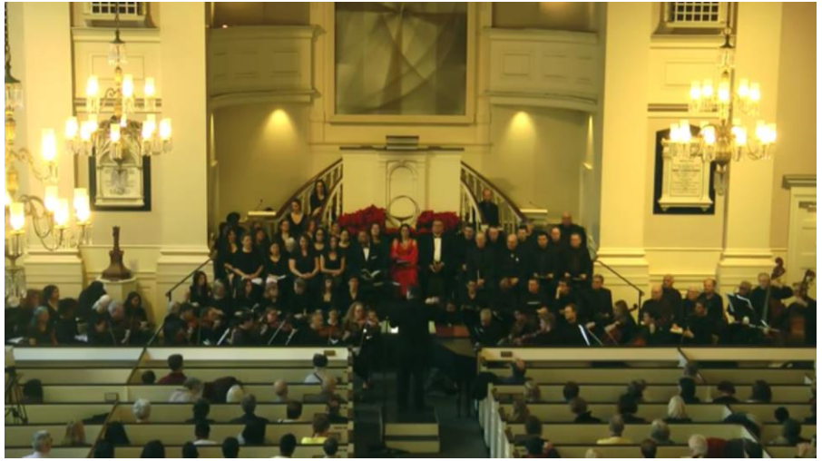
Lyt til Händels Messias , opført af Schiller Institutets Kor i New York: http://schillerinstitut.dk/si/?p=10778

Jeg vil gerne have, at folk lige tænker et øjeblik; se jer omkring, tænk på kulturen i dag, populærkulturen. Populærkulturen, specielt den vestlige, er blevet så forfalden, så fordærvet. I løbet af det 20. århundrede er kulturen skridt for skridt blevet værre og værre. Der er intet menneskeligt tilbage. Der er intet universelt tilbage i film, skuespil eller populærmusik; og heri medregner jeg de populære udtryk for såkaldt klassisk musik.