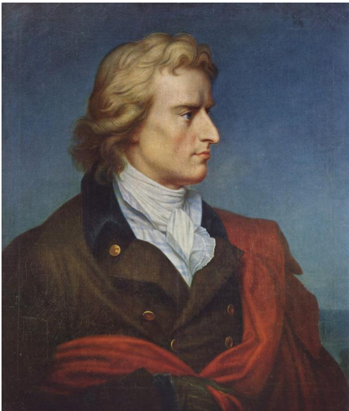
Friedrich Schiller, frihedens poet (1759 – 1805).

befri menneskeheden er ikke noget praktisk, ikke noget, der aktuelt eksisterer i menneskeheden, i samfundet. Man må skabe et nyt potentiale hos menneskeheden. Og Schiller sagde, at den eneste måde, hvorpå dette kan lade sig gøre, er gennem skøn kunst.