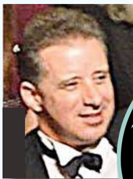
Tidligere MI6-agent Christopher Steele