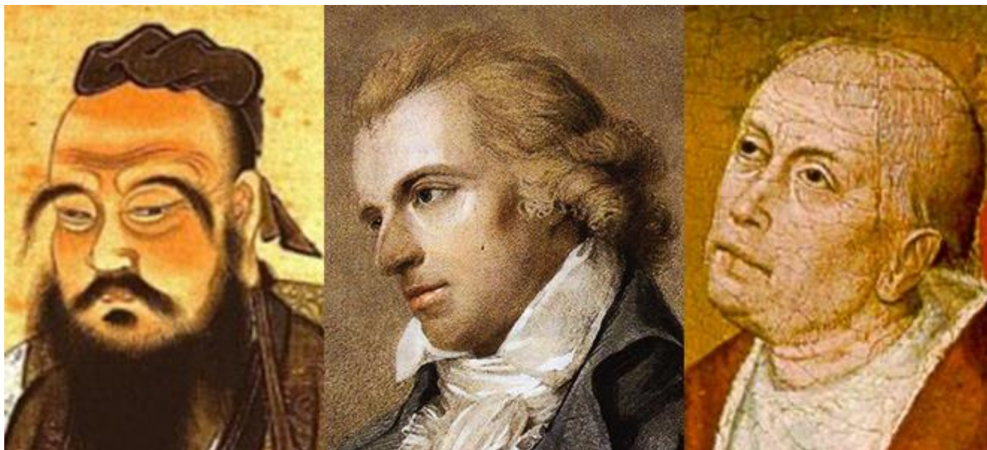
Fra venstre: Konfucius, Schiller, Cusanus.

bringes i overensstemmelse med verdensordenen således, at naturlig lovs ret til lykke kan opnås af alle i samfundet.