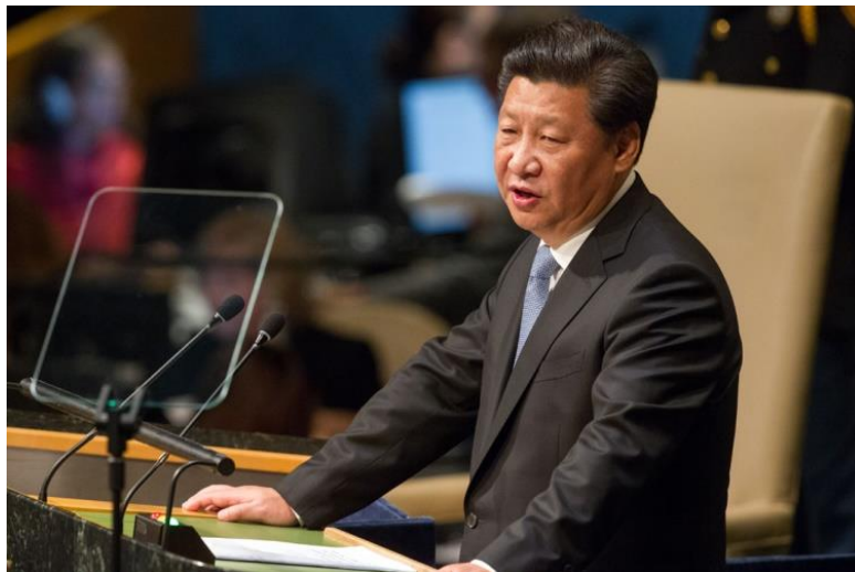
Folkerepublikken Kinas præsident Xi Jinping taler for FN's Generalforsamling, 28. september, 2015.

I sin nylige, årlige pressekonference kom den russiske udenrigsminister Sergei Lavrov med en lignende pointe med hensyn til det frie Vestens værdier, som det uophørligt forsøger at påtvinge alle ikke-vestlige lande. »Dette er sandsynligvis ikke de værdier, der blev antaget af nutidens bedstefædre – europæere –«, sagde Lavrov; »men noget nyt og moderniseret. Hvor alt er tilladt, ville jeg sige. De er radikalt og fundamentalt i modsætning til de værdier, der er videreført fra generation til generation i