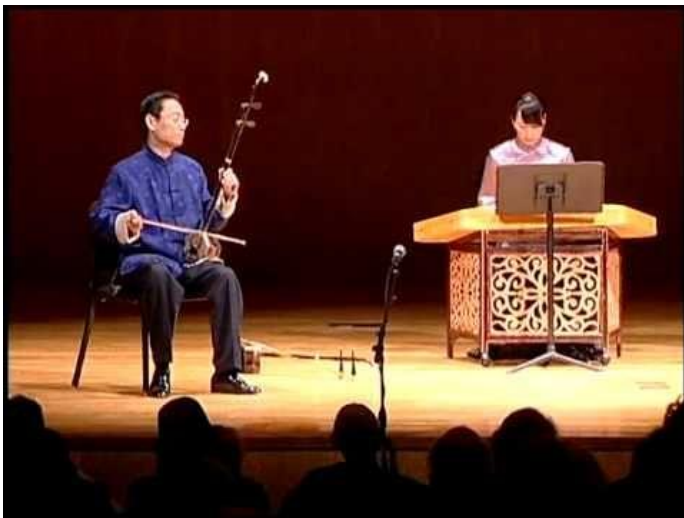
Musikere opfører traditionelle kinesiske sange for strengeinstrumenterne ehru og guzheng.

efter, at »digterne er de ikke-anerkendte lovgivere i verden«.