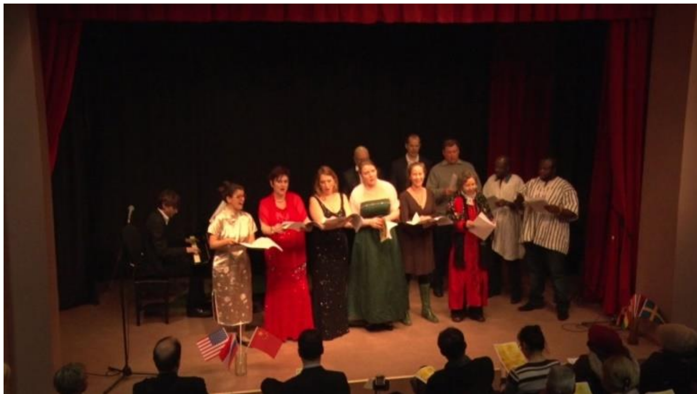
Kunstnere opfører klassik musik fra Asien, Afrika og Europa. Schiller Institutets koncert, »En musikalsk dialog mellem kulturer«, København, februar, 2017.

bedrøvelig uden beherskelse og glad uden besindighed. Det overlegne menneske forsøger derfor at skabe harmoni i det menneskelige hjerte gennem at genopdage den menneskelige natur og forsøger at fremme musik som midlet til at fuldkommengøre menneskelig kultur. Når en sådan musik er fremherskende og menneskers sind føres mod de rette idealer og forhåbninger, vil vi se fremkomsten af en stor nation. Karakter er ryggraden i vores menneskelige natur, og musik er karakterens blomstring.«