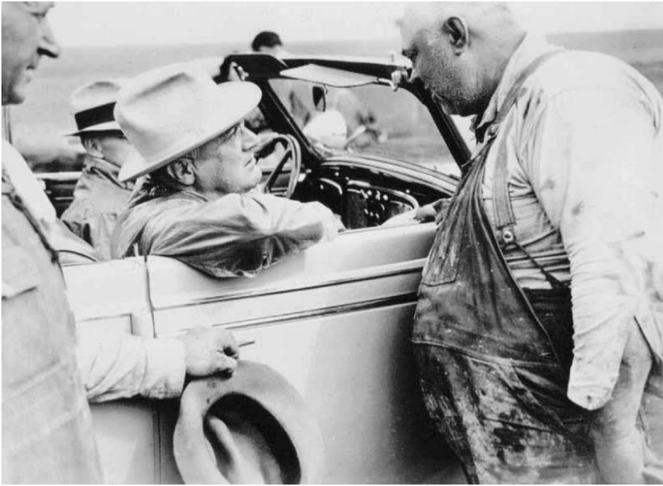
Præsident Franklin D. Roosevelt taler med en 'home-steader', en selvstændig farmer, i North Dakota, 1936.

udbetalt lønninger, der ikke gør det muligt for dem at forsørge sig selv eller deres familier. Denne ødelæggelse af social reproduktion fratager nationen den fremtidige generation af faglærte arbejdere, videnskabsfolk, læger og andre, der udgør fundamentet for enhver nation, der har fremgang.