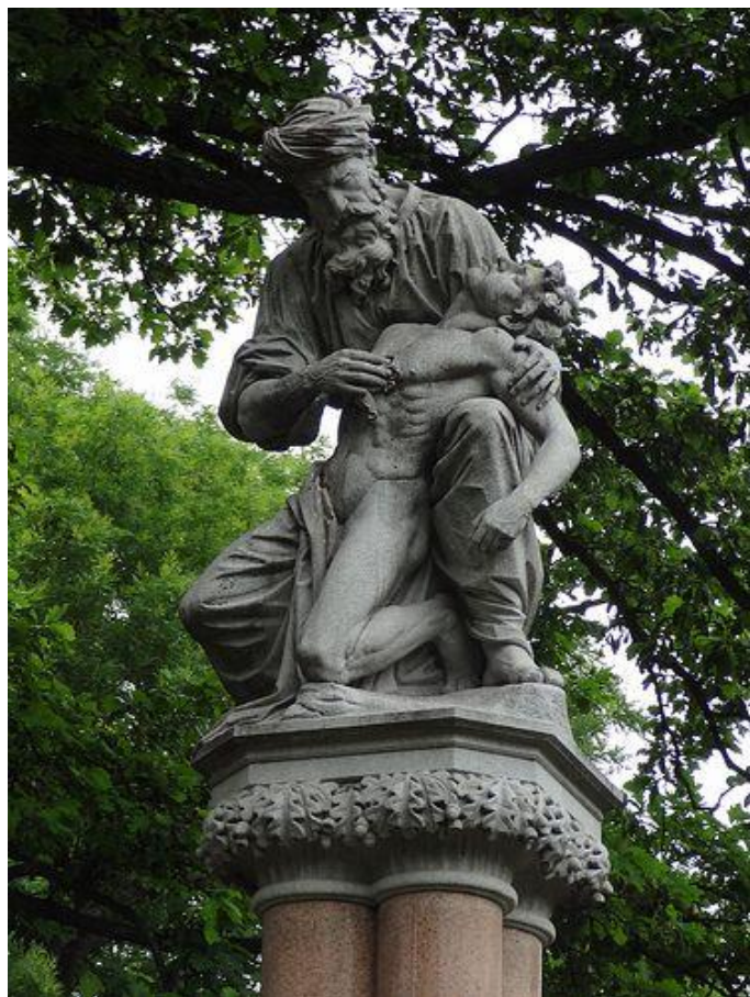
Den barmhjertige Samaritaner af John Quincy Adams Ward, 1867, Boston Public Gardens.

I vores tid, det 21. århundrede, bragte de nylige præsidentvalg de »glemte« mænd og kvinder i vores samfund, der var ladt i stikken af årtiers neoliberale politikker, som beroede på grådigheden hos et finansoligarki, og hvor Forfatningens grundlæggende tema om »det almene vel« næsten fuldstændigt forsvandt, frem i forgrunden. »Guds veje er uransagelige« og gav os en ny præsident, Donald Trump, der i sin sejrstale sidste november erklærede: »De glemte mænd og kvinder i vort land vil ikke længere blive glemt. Nu lytter alle til jer.« Han opfordrede dernæst til enhed, til, at både Demokrater