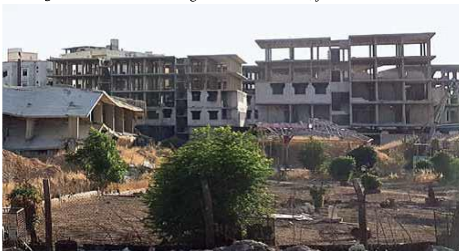
Alle ødelagte boligblokke, der sås i krigszoner i Damaskus, som tidligere var besat af væbnede oprørere, var ved at blive repareret.

Terrorister fra en nærliggende terroristkontrolleret forstad, lancerede, på fjerdedagen af handelsmessen, fra en granatkaster en granat, der ramte siden af indgangsbygningen til messeområdet. Ni mennesker blev dræbt, og mange blev såret, da granaten ramte stenfortovet og spredte dødbringende splinter. Blandt de dræbte var en kvindelig eksportmanager og hendes mand. Senere inspicerede denne forfatter sporene efter granatsplinterne på bygningen og de knuste ruder.