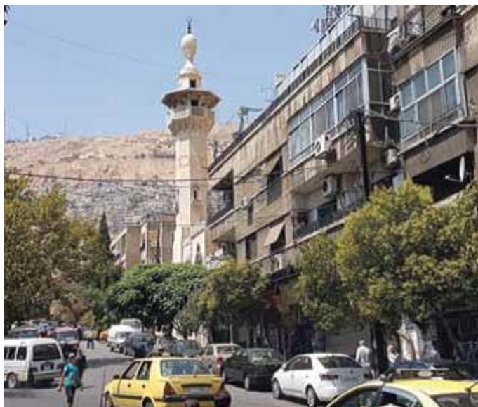
Det centrale Damaskus er en smuk og travl by.