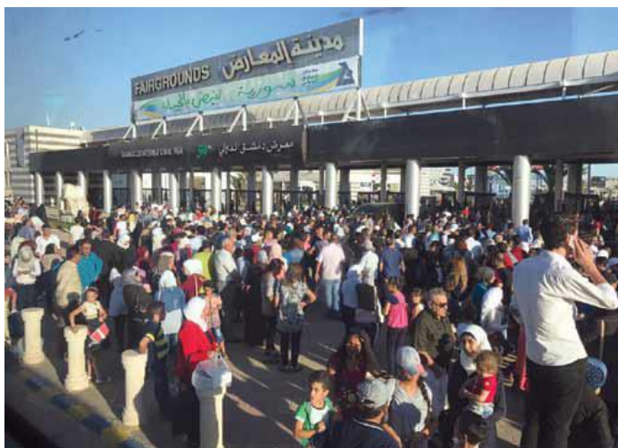
Støtten til den Internationale Handelsmesse fra det syriske folk var massiv, med 300.000 besøgende om dagen.

EIR, 4. sept., 2017 – De Syriske Væbnede Styrkers utrolige momentum, hvor de har generobret store områder af syrisk territorium fra ISIS og andre terroristgrupper, aktiverer nu den økonomiske genrejsning i Syrien. Med kun fire måneders leveringstid har den syriske regering orga-