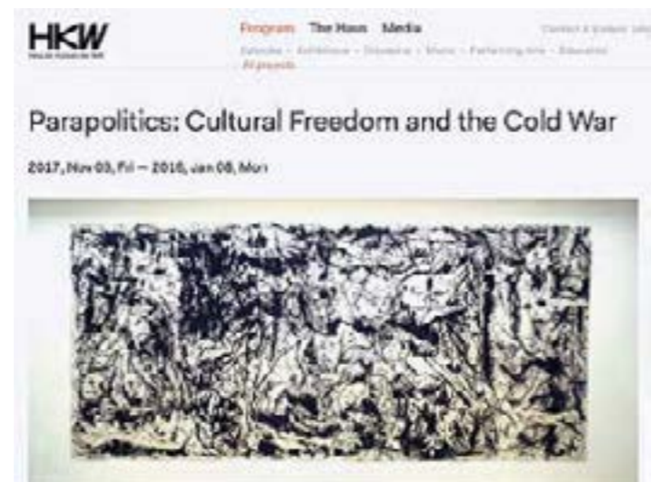
Museumsudstilling i Berlin over Kongressen for Kulturel Frihed (CCF).

CCF's mål var i høj grad Frankfurterskolens mål. De ønskede at ødelægge idealisme og klassisk kultur. For Adorno, f.eks., fremførte, at idealisme fører til nazisme, fordi det fører til et radikalt livssyn, og det må rykkes op med rode, både for at udslutte resterne af nazisme, men også af Sovjetunionens diktatur. Adorno sagde, at, for at gøre dette, må skønhed fuldstændigt udslættes af kunst. Husk på, at Schiller sagde, at