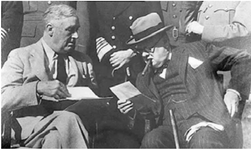
USA's præsident Franklin D. Roosevelt (venstre) og den britiske premierminister Winston Churchill forhandler i Casablanca, Marokko, 22. jan., 1943.