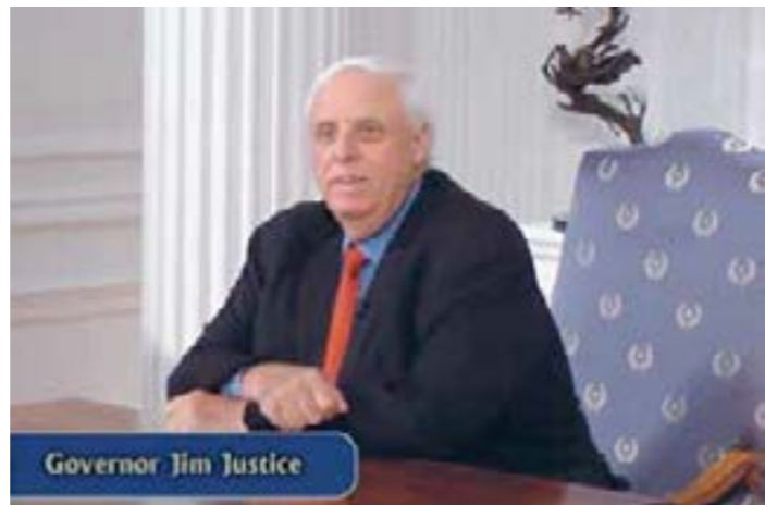
Guvernør for Vest Virginia Jim Justice diskuterer på en pressekonference den 13. nov., 2017, investeringsaftalen til $83 mia. mellem Vest Virginia og China Energy Investment Corporation.

Det vigtigste spørgsmål rent strategisk er selvfølgelig, hvis man tænker over det, om vi kan undgå den såkaldte Thuky-