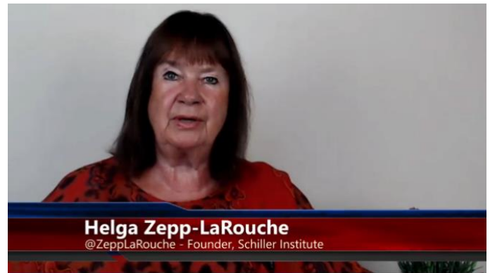
Schiller Instituttets stifter og præsident, Helga Zepp-LaRouche.

Dette potentiale ses i genoplivelsen af Trump-Kim-topmødet, som kunne føre til en officiel afslutning af Koreakrigen og ligeledes muligvis sluttelig til et atomvåbenfrit, forenet Korea; det ses ligeledes i rapporterne om den igangværende planlægning af et Trump-Putin-topmøde, som kunne adressere de farlige spændinger mellem de to nationer, der er et resultat af en række nylige, britiske provokationer. At disse to topmøder går fremefter, på trods af den vedvarende giftighed, som kommer fra Made-in-London-Russiagate-skandalen, beviser, at denne dynamik kan overvinde de transatlantiske politikkers uophørlige fordærvelse. Der er en voksende fornemmelse af desperation i den juridiske